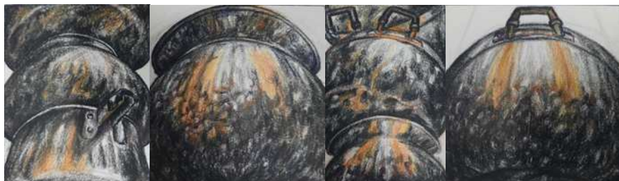
ภาพที่ 2 ร่างผลงาน

4.3 การทำภาพร่าง ผู้สร้างสรรค์เริ่มต้นจากการทำภาพร่างต้นแบบด้วยวิธีวาดเส้นบนกระดาษเพื่อค้นหารูปทรงและองค์ประกอบที่ตอบสนองต่อแนวความคิดเพื่อให้เห็นภาพโดยรวมของผลงานและง่ายต่อการปรับปรุงแก้ไขก่อนนำไปสู่ขั้นตอนการสร้างสรรค์ผลงานจริง โดยร่างภาพได้แรงบันดาลใจมาจากวัตถุเครื่องครัวที่บุพการีใช้งานจริง ผู้สร้างสรรค์ถอดแบบเอาอารมณ์ความรู้สึกของหม้อที่มีคราบร่องรอยพอกพูนด้วยประสบการณ์อันมีชีวิตของบุพการี นำมาขยายใหญ่จัดองค์ประกอบเน้นจุดศูนย์กลางเป็นจุดเด่น ที่มีคติการจัดวางองค์ประกอบศิลป์จากพระประธานในโบสถ์ จากนั้นระบายสีเหลืองทองเพื่อกำหนด แสง-เงา ตกกระทบทับอีกครั้งเพื่อเป็นการสร้างมิติรูปทรงโดยการร่างภาพจะใช้อุปกรณ์ในการสร้างสรรค์ จัดทำภาพร่าง (Sketch Drawing) โดยการวาดใส่กระดาษสมุด (Sketch) เพื่อภาพที่สมบูรณ์ก่อนขยายเพื่อสร้างสรรค์ชิ้นจริงโดยอุปกรณ์ในการทำภาพร่างมีดังนี้ดินสอสี, ดินสอEE, ยางลบ, สมุด (Seikai)