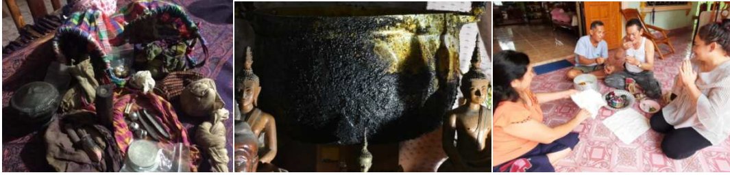
ภาพที่ 10 ภาพองค์ความรู้ใหม่จากการศึกษาข้อมูล สัญญะความดีงามในวัตถุ