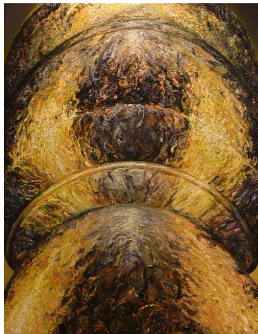
ภาพที่ 8 ผลงานสร้างสรรค์ชื่อผลงาน สัญญะความตึงามในวัตถุ 15 ขนาด 240x190 เซนติเมตร เทคนิค สีน้ำมันบนผ้าใบ