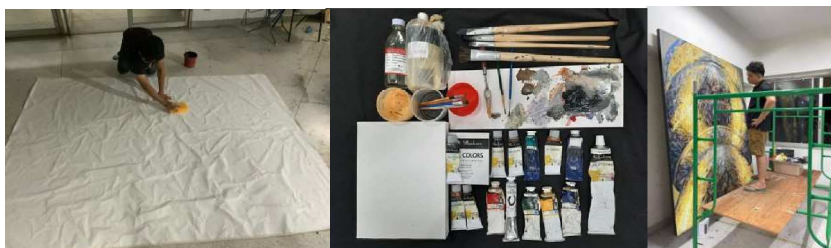
ภาพที่ 3 การเตรียมวัสดุและอุปกรณ์

4.4 การเตรียมวัสดุและอุปกรณ์การสร้างสรรค์มีการจัดเตรียมเพื่อให้มีความพร้อมในการสร้างสรรค์ผลงานโดยผู้สร้างสรรค์จะเตรียม ไม้และผ้าแคนวาสเคลือบสำเร็จ เพื่อนำมาประกอบสร้างเป็นเฟรมผ้าใบจัดเตรียมตามขนาดที่ต้องการสร้างสรรค์ และ สีน้ำมัน, พู่กัน, น้ำมันละลายสี (Linseed oil), น้ำมันล้างพู่กัน