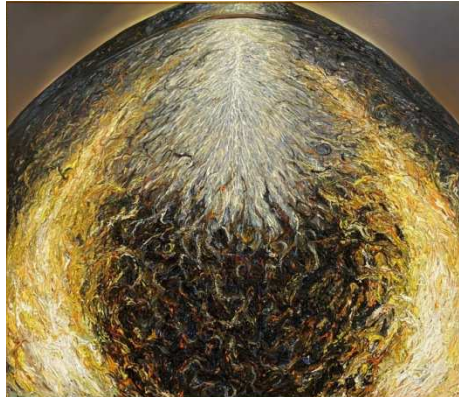
ภาพที่ 7 ผลงานสร้างสรรค์ชื่อผลงาน สัญญะความตึงามในวัตถุ 12 ขนาด 150x130 เซนติเมตร เทคนิค สีน้ำมันบนผ้าใบ