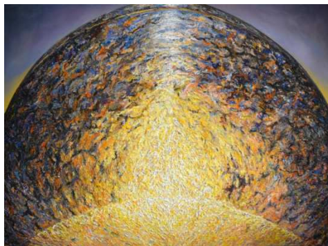
ภาพที่ 4 ผลงานสร้างสรรค์ชื่อผลงาน สัญลักษณ์ความตึงามในวัตถุ 5

5.2 การสร้างสรรค์ผลงานจิตรกรรม 2 มิติ ในรูปแบบกึ่งนามธรรม(Semi Abstract) จัด องค์ประกอบเน้นจุดศูนย์กลางเป็นจุดเด่นสัญลักษณ์กายภาพที่เป็นรูปทรงของวัตถุแสดงถึงพ่อแม่เป็น มุมมองจากอุดมคติ นำเสนอเป็นมุมมองของมด (Ant's-Eye View) ให้ความรู้สึกถึงความสูงส่ง ยิ่งใหญ่ มีเส้นนำสายตาที่พุ่งสูงชัน มีที่มาจากมุมมองดูยอดเจดีย์, พระประธานให้ความรู้สึกเป็นสิ่งที่ทรงคุณค่า สูงส่งแตกต่างในสถานะทั่วไป ขยายภาพให้ใหญ่กว่าปกติหลายเท่า เพื่อสอดคล้องกับแนวคิดของผู้ สร้างสรรค์ ด้วยความยิ่งใหญ่จึงมีกำลังปะทะอย่างโดดเด่นอิมเมสซางามน่าเลื่อมใส สะท้อนความดี งามความยิ่งใหญ่ไพศาลของพระในบ้านผสานกับการเขียนภาพแบบ เอ็กซ์เพรสชันนิสม์ (Expressionism) ที่สื่อตรงออกมาจากอารมณ์ความรู้สึกที่บริสุทธิ์ของผู้สร้างสรรค์ ผสานเข้ากับ เทคนิควิธีการระบายสีแบบตัวด ทับซ้อน ขูดขีด ปาดป้ายสี(Impasto) สีประสานกันอย่างฉับพลัน จังหวะพู่กันแต่มลงเป็นจังหวะของลมหายใจเข้าออก ก่อรูปทรงโดยปริมาณสี เกิดร่องรอยพอกพูน หนาแน่นเป็นพื้นผิวของสีเพื่อตอกย้ำการทำซ้ำไปซ้ำมาเกิดเป็นรูปทรงของวัตถุในอุดมคติที่ทำให้ผลงาน รู้สึกมีพลังที่ยิ่งใหญ่มากขึ้นจังหวะของฝีแปรงให้มีทิศทางเส้นนำสายตาพุ่งสูงภาพผลงานปะทะ ความรู้สึก ยิ่งใหญ่สมบูรณ์ และ จัดแสงเงา ที่ตกกระทบวัตถุผู้สร้างสรรค์ได้ทีมาจากแสงเทียนหน้า พระประธานเปล่งประกายให้ความรู้สึก เลื่อมใส ศรัทธา ผลงานมีความอบอุ่นมีชีวิตชีวาสง่างาม บริสุทธิ์ เชิดชูบูชาคุณงามความดีของพ่อแม่สอดคล้องกับจุดประสงค์ของผู้สร้างสรรค์ได้เป็นอย่างดี