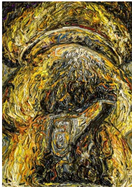
ภาพที่ 6 ผลงานสร้างสรรค์ชื่อผลงาน สัจญะความดิงามในวัตถุ 10 ขนาด 240x190 เซนติเมตร เทคนิค สีน้ำมันบนผ้าใบ