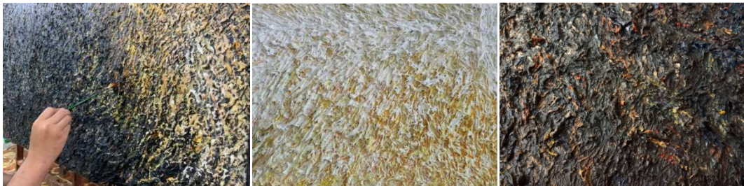
ภาพที่ 9 ภาพองค์ความรู้ใหม่จากการศึกษาสร้างสรรค์ผลงาน สัญญะความดั่งามในวัตถุ

องค์ความรู้ใหม่จากการศึกษาและสร้างสรรค์ผลงาน สัญญะความดั่งามในวัตถุ ทราบว่า เทคนิคกลวิธีระบายสีของขั้นตอนสร้างรูปร่างรูปทรงและการเขียนจุดสี พบว่าจะแต้มสีเป็นจุดจนสี พอกพูนหนาแสดงสัญญะของการกระทำการลงแรง แทนเหนือทุกหยดของบุพการี แต้มสีที่ละจุด เหมือนจังหวะเข้า-ออกของลมหายใจของผู้สร้างสรรค์ที่ได้ทราบสำนึกความดั่งามจากอดีตที่เป็นวัตถุที่ใส สะอาดมาถึงปัจจุบันที่เต็มไปด้วยร่องรอยที่ผ่านการใช้งาน บันทึกประวัติศาสตร์ที่หนานูนซ่อนทุกลม หายใจ ทุกการกระทำทุกความดั่งามของบุพการีสีผสมผสานเข้าด้วยกันเป็นรูปทรงแห่งความดั่งาม เทคนิคกลวิธีนี้สร้างความน่าสนใจมีความเชื่อมโยงกับวัตถุ เป็นสัญญะผูกพันเรื่องราวที่ซ่อนความดี งามไว้ เป็นผลองค์ความรู้ใหม่ที่เกิดขึ้นในการสร้างสรรค์