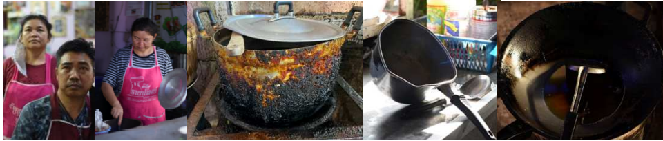
ภาพที่ 1 ข้อมูลภาคสนาม

ถึงตัวตน เห็นคุณค่าความดีงามของชีวิตพร้อมกับแม่ที่รักและเสียสละอย่างบริสุทธิ์ ในขณะที่เดียวกันความรัก ความเป็นห่วงหวั่นพวการที่มีต่อบุตรในครอบครัวที่คอยให้กำลังใจแม่เหนื่อยล้าเพียงใดก็จะเป็นผู้ให้เสมอจึ่งมองเห็นความสุขแทนที่ความทุกข์อย่างสนิท สิ่งนี้เป็นคุณค่าชีวิตที่ยิ่งใหญ่ที่ผู้ใดแทนไม่มี สิ่งเหล่านี้ควรค่าแก่การเชิดชูบูชาความดีงาม