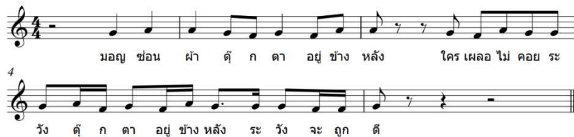
ภาพที่ 3 โน้ตเพลงการละเล่นมอญซ่อนผ้าแบบที่ 3

5.1.3 การละเล่นมอญซ่อนผ้า แบบที่ 3 ชุมชนบ้านโพธิ์พระยา ตำบลโพธิ์พระยา อำเภอมือง จังหวัดสุพรรณบุรี จากการศึกษาการละเล่นมอญซ่อนผ้า แบบที่ 3 ผู้วิจัยสามารถแบ่งหัวข้อการวิเคราะห์โครงสร้างของเพลงที่ใช้ประกอบการละเล่นมอญซ่อนผ้า แบบที่ 3 ตามองค์ประกอบที่ตั้งไว้ ดังนี้