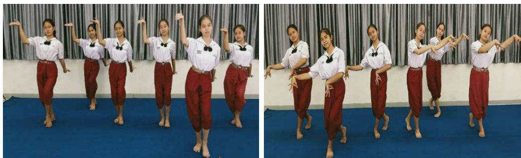
ภาพที่ 7 ระบำมอญซ่อนผ้า ช่วงที่ 3