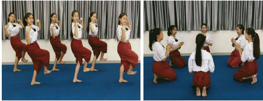
ภาพที่ 5 ระบำมอญซ่อนผ้า ช่วงที่ 1

การสร้างสรรค์ระบำมอญซ่อนผ้าประกอบการบรรเลงชุดนี้เป็นอนุรักษ์การละเล่นชนิดนี้ที่กำลังจะได้รับความนิยมน้อยลงเพื่อให้คงอยู่กับวัฒนธรรมของการละเล่นเด็กไทยสืบไป