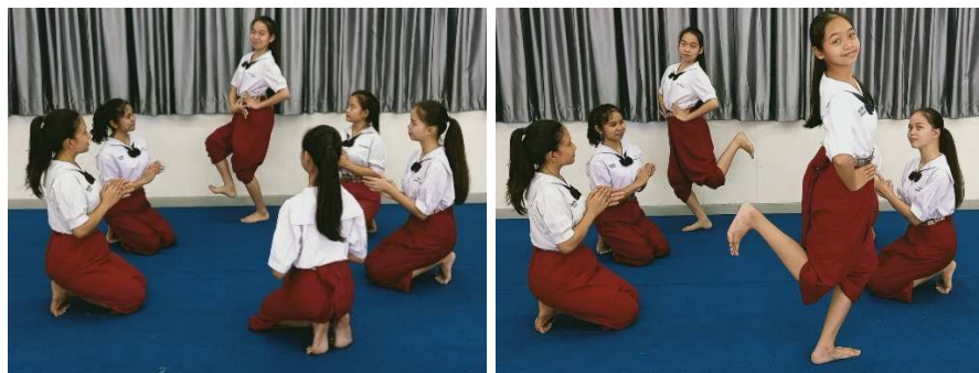
ภาพที่ 6 ระบำมอญซ่อนผ้า ช่วงที่ 2